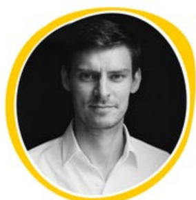
Павел Гуров gurovagency.com

Видеоблогер. Автор самого популярного русскоязычного канала для мужчин.