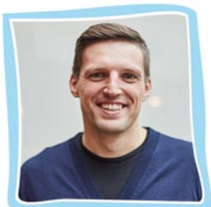
Павел Багрянцев Предприниматель

Видеоблогер. Автор самого популярного русскоязычного канала для мужчин.